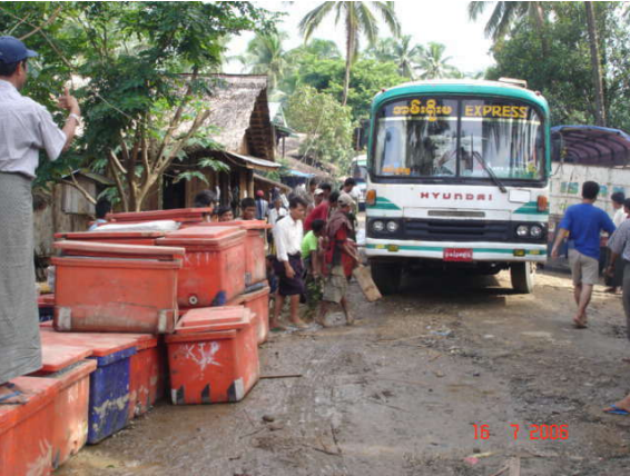
သဘာဝရောင်ထွက်ပစ္စည်းများနှင့် ပုစွန်ကို တွင်ကျယ်စွာထုတ်လုပ်နေပုံ

အထက်ပါနည်းစနစ်အရ ပုစွန်လုပ်ငန်း တနေ့တခြားကျယ်ပြန့်လာပြီး လက်ရှိပုစွန်အတွက် နှုန်းပမာဏ လျော့မသွားအောင် ထိန်းသိမ်းထားရသောကြောင့် လမုတောများ ပျက်သုန်းမှုမှာ လည်းတဖြည်းဖြည်းများပြားလာလေသည်။ မြန်မာ့နေမဂ္ဂဇင်း အရ ရခိုင်ပြည်နယ်၌ ၁၉၉၉ ခုကြား ပုစွန်မွေးကန်ကေ (၃၀ ၃၅၀) ခန့် တိုးချဲ့လာခဲ့ပြီး တပြည်နယ်လုံး၏ စုစုပေါင်းကေမှာ ၄၆၇၂၃ ခန့် ဖြစ်သွားခဲ့လေသည်။ နောက် လေးနှစ်တာကာလ အတွင်း မြေရေယာအသုံးပြုမှု ပမာဏမှာ ၃ဆခန့် မြင့်တက် သွားရာ ၂၀၀၃ခုနှစ်တွင် စုစုပေါင်း (၁၅၅၅ ၃၃) ကေခန့် ဖြစ် သွားခဲ့သည်။ ဤသို့ ပုစွန်မွေးမြူရေးလုပ်ငန်းများ အကြီး အကျယ် ချဲ့ထွင်လာခြင်းကြောင့် ဒေသခံ များ၏ လူမှုဘဝများ ပျက်ဆီးခံလိုက်ရပြီး ဇီဝဂုဏ်မျိုးကွဲများ သည်လည်း ပျက်သုန်း လာရ လေသည်။ တဖန်သဘာဝဘေး အန္တရာယ်မှ ကာကွယ် ပေးနေသည့် အရေးပါသော သဘာဝ အတားအဆီးကြီးတစ်ခု လည်း ပျောက်ကွယ်သွားရပြီ ဖြစ်သည်။ လယ်ကွင်းများမှာ လည်း ပင်လယ်ရေလွှမ်းမိုးမှုဒဏ် မကြာခဏခံလာရလေသည်။