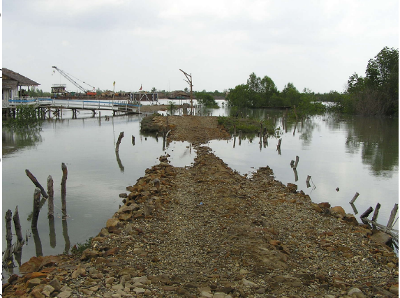
ကြီးမားသောစီးပွားရေးလုပ်ငန်းကြောင့် ပျက်စီးသွားသော ရခိုင်ဒေသရှိ လမုတောကြီးများ

ဤသည်မှာဒေသခံအလုပ်သမား အင်အားစုများအား ဆုတ်ယုတ်အောင်ပြုလုပ်နေခြင်းပင်ဖြစ်သည်။ ထို့ကြောင့် မြန်မာပြည်တွင်နိုင်ငံရေးပြုပြင်ပြောင်းလဲမှု ဖြစ်လာသောအခါ၌ ဒေသဆိုင်ရာစီးပွားရေးလုပ်ငန်းများအား ရေရှည်ထိန်းသိမ်းနိုင်ရန် အခက်အခဲများရှိလာပေမည်။ အကြောင်းမှာ ၎င်းစီးပွားရေးလုပ်ငန်းများအား ကျောထောက်နောက်ခံပေးနေသော အလုပ်သမားများရှားပါးသွားရသောကြောင့်ဖြစ်သည်။