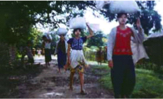
နအဖစစ်တပ်မှ အတင်းအဓမ္မစေခိုင်းမှုဖြင့် စပါးအိတ်ထမ်းနေသော ရခိုင်ပြည်နယ်မှ အမျိုးသမီးများ

ရခိုင်ပြည်နယ်သည် မြန်မာနိုင်ငံ၌ ဆန်စပါးအများဆုံး ထွက်ရှိသောနေရာများအနက် တစ်ခုဖြစ်လေသည်။ လွန်ခဲ့သော ဆယ်စုနှစ် နှစ်ခုမှစပြီး လယ်သမားအများစုမှာ ဓါတုဓါတ်မြေဩဇာနှင့် မျိုးစေ့များကို အစိုးရထံမှ မဝယ်မနေရ ဝယ်ယူနေကြရ လေသည်။ အစိုးရကဓါတ်မြေဩဇာနှင့် မျိုးစေ့ရောင်းချလျက် စီးပွားရေးလုပ်နေကြသည်။ လယ်သမားတို့မှာ အစိုးရနှင့် အာဏာပိုင်တို့အား ဆန်စပါးကို ဈေးကွက်ဈေးနှုန်းထက်လျော့ချ၍ရောင်းနေကြရသည်။ တဖန်လယ်ယာစိုက်ပျိုးရာ၌လည်း လယ်သမားများမှာ စိုက်ပျိုးရေးနည်းစနစ်သစ်များအသုံးပြုရန် အတင်းအဓမ္မခိုင်းစေခံနေကြရသည်။ သို့သော်လည်း ဤနည်းစနစ်မှာ လယ်သမားတို့၏ ဗဟုသုတ၊ ကြိုက်နှစ်သက်မှုတို့နှင့် ဆန့်ကျင်နေလေသည်။ ထို့ကြောင့် ၎င်းနည်းစနစ်အား လျစ်လျူရှုထားလိုက်ကြသည်။ ရခိုင်ပြည်နယ်ရှိ မြေနိမ့်ဒေသများနှင့် ပင်လယ်နှင့် အနီးအနားတွင်ရှိသောဒေသများတွင် မကြာခဏ မြစ်ရေ ပင်လယ်ရေ လွှမ်းမိုးတတ်သဖြင့် အတွေ့အကြုံရင့်ကျက်ပြီးဖြစ်သော လယ်သမားတို့မှာ ကောက်ပဲသီးနှံတို့အား မည်ကဲ့သို့ ပြုစုပျိုးထောင်ရမည်ဆိုသည်ကို သိရှိပြီးသားဖြစ်လေသည်။ ဒေသခံများသည် ရာသီဥတုပြောင်းလဲမှုများနှင့်အညီ မိရိုးဖလာနည်းအရ စိုက်ပျိုးကြလေသည်။ ဥပမာအားဖြင့် သူတို့သည် လယ်ယာမြေများ မထွန်ယက်မီ မိုးရာသီ၌ အများဆုံး ဖြစ်ထွန်းသော စပါးစေ့များအားရွေးချယ်ကြရမည်ဖြစ်သည်။ ဤကျွမ်းကျင်မှုများအပေါ် နအဖ တို့က ဂရုမစိုက်ကြဘဲ စိုက်ပျိုးရေးနည်းစနစ်သစ် ကိုသာ အသုံးပြုရန် စေခိုင်းလျက်ရှိလေသည်။ ယင်းကြောင့် စပါးအထွက်နှုန်းမှာ ထိခိုက်လာရသည်။