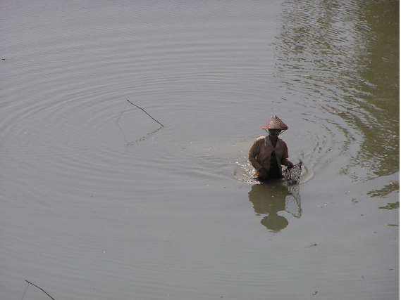
မြန်မာပြည်မှ အမျိုးသမီးအများစုမှာ အတင်းအဓွမစေခိုင်းသည့်အမိန့်အောက်မှ မိမိအသက် ရှင်သန်ရပ်တည်မှုအတွက် ရှာဖွေစားသောက်နေကြရသည်

စစ်တပ်ရင်းများအတွက် လုံလောက်သော ထောက်ပံ့မှု မပေးကြချေ။ တဖန်စစ်တပ်များမှာ ကိုယ်ပိုင် လုပ်ငန်းများမှ ဝင်ငွေများဖြင့်ရပ်တည်နိုင်ရမည်ဟု နအဖ က သတ်မှတ်ထားလေသည်။ ယေဘုယျအားဖြင့်စစ်တပ်၏ ‘ကိုယ့် ခြေ ထောက်ပေါ်ကိုယ် ရပ်တည်ရေးမူဝါဒ’ အဖြစ်လူသိများသော အထက်ပါ လိုအပ်ချက်များကြောင့်လည်း ရခိုင်ပြည်နယ်ရှိ လမုတောများမှာ ပျက်စီး လာပြန်သည်။ စစ်တပ်ရင်းများမှာ သူတို့ကိုယ်သူတို့ထောက်ပံ့နိုင်ရန်အတွက် ဝင်ငွေကောင်း သောလုပ်ငန်းများဖြစ်သည့် အုတ်ဖုတ်ခြင်း၊ သစ်ထုတ်လုပ် ရောင်းချခြင်း၊ ရော်ဘာထုတ်လုပ်ခြင်း၊ ပုစွန်မွေးမြူခြင်းနှင့် တခြားသော စိုက်ပျိုးရေးလုပ်ငန်းများအား လုပ်ကိုင်နေကြရသည်။ ဤလုပ်ငန်းများ လုပ်ကိုင်ဆောင်ရွက်ရန်အတွက် လယ်ယာမြေအမြောက်အများနှင့် သစ်တောများအား သိမ်းယူလိုက်ကြသည်။ စစ်တပ်လုပ်ကိုင်နေသော လုပ်ငန်းများ အနက် အုတ်ဖုတ်လုပ်ငန်းမှာ