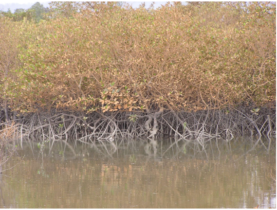
ဆားငံရေကြောင့် ပျက်စီးနေသော လမုတော

ရခိုင်ပြည်နယ်၊ တနင်္သာရီတိုင်းနှင့်ဧရာဝတီတိုင်းတို့တွင် အလှူပယ်ပေါက်ရောက်တွေ့ရှိရသော လမုတောကြီးများသည် တန်ဖိုးမမြတ်နိုင်သော သဘာဝအရင်းမြစ်ကြီးတစ်ခု ဖြစ်သည်။ သို့သော်အဆိုပါလမုတောကြီးများသည် လျှင်မြန်စွာ ပျက်စီး ပြုန်းတီးမှုကြောင့်နှင့် ရင်ဆိုင်နေရပြီဖြစ်သည်။ လူသားများ ကြောင့်ပြုန်းတီးကွယ်ပျောက်သွားရသော လမုတောများ အဖို့ အသစ်တဖန်ပြန်လည်ပေါက်ရောက်ရန်မှာ မလွယ်ကူချေ။ ကမ်း ရိုးတန်းတလျှောက်နေ မြန်မာ့လူ့အဖွဲ့အစည်းတို့၏ လူမှုစီးပွား ဘဝရပ်တည်ချက်များပေါ်တွင် လမုတောကြီးများက အရေးပါ သောဝတ္ထုပစ္စည်းတို့ကို ကာလတာရှည်စွာ ဖန်တီး ပေးခဲ့ကြပြီး ဖြစ်သည်။ အထူးသဖြင့်ရခိုင် ပြည်သူတို့၏ လူမှုဘဝ ရပ်တည်မှု အတွက် ဤလမုတောကြီးများ၏ အကျိုး ကျေးဇူးကား ကြီး မားလှပေသည်။ ရခိုင်ပြည်နယ် ၌ လမုတော (၄၁၄၄၇၇) ဧက