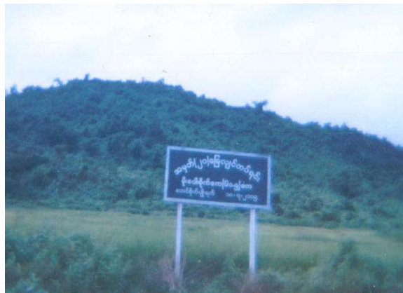
နအဖတပ်ပိုင်မြေအဖြစ် အတင်းအဓမ္မသိမ်းယူထားသည့် မြေပေါ်တွင် ဆိုင်းဘုတ်တင်ထားပုံ

ပြည်တွင်းဆားထုတ်လုပ်မှုမှာ မကြာသေးမီက ခေတ်မှီနည်းပညာများကြောင့် သိသိသာသာတိုးတက်ပြောင်းလဲသွား ပြီဖြစ်သည်။ ဘင်္ဂါလားဒေ့ရှ်နိုင်ငံ၌ ပြည်တွင်းဆား ထုတ်လုပ်မှု တိုးတက်လာသည်နှင့်အမျှ ရခိုင်လယ်သမားများ၏ အမြတ် ဝင်ငွေမှာ လည်းကျဆင်းသွားရလေသည်။ ဒေသခံ ဆားတွင်း ပိုင်ရှင်များကဆား (၂ ဒသမ ၅) ကီလိုဂရမ်ရရှိရန် ကျပ်ငွေ (၁၅) မှ (၂၀) ကျပ်ထိ အရင်းစိုက်ရသည်ဟုဆိုသည်။ ဆား (၂.၅) ကီလိုဂရမ်အားရောင်းလိုက်ပါကလည်း (၂၅) ကျပ်သာ ရရှိလေသည်။ အမြတ်ငွေ (၅) ကျပ်မှ (၁၀) ကျပ်ကြားရရှိခြင်းဖြင့် ဆားကွင်းပိုင်ရှင်များအတွက် အသက်ရှင်ရပ်တည်ရန် မလုံလောက်ပေ။